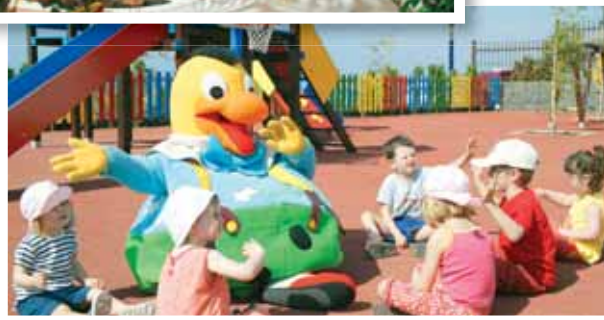
Tenerife – blómaeyjan.