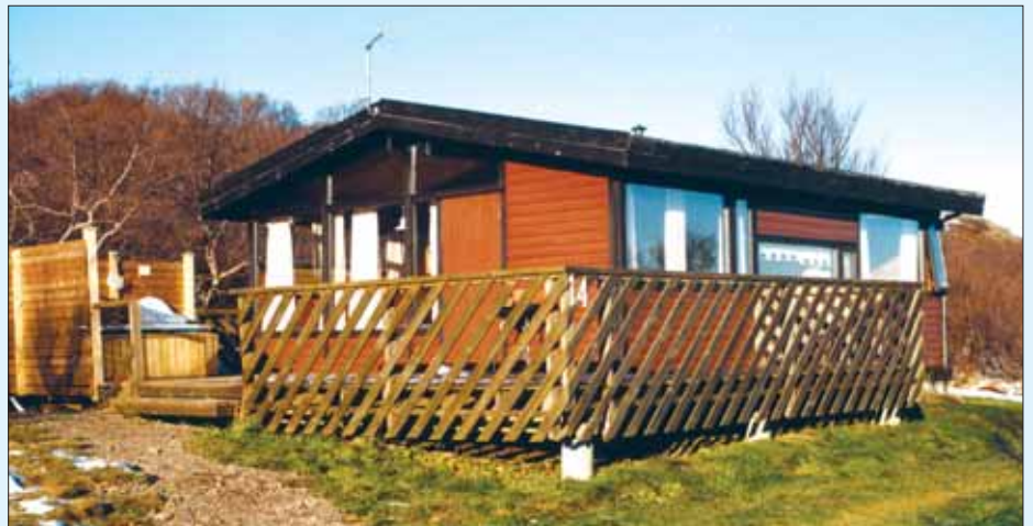
Sumarhúsið sem Sjúkraliðafélag Íslands leigir út í Munaðarnesi er við Vörðuás 14.

Skammt frá Munaðarnesi, vestan við þjóðveginn og beint á móti, er jörðin Stóru Skógar sem BSRB keypti árið 1982 og byggði þar nýtt hverfi sumarhúsa. Í landi Stóru Skóga er Hólmavatn, sem er að hluta til í eigu jarðarinnar. Upplagt er að ganga þangað í