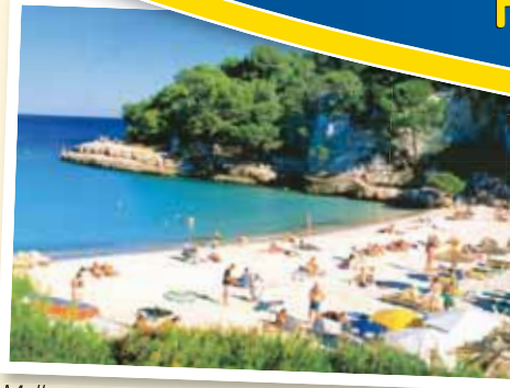
Mallorca – eyjan sem hefur allt.