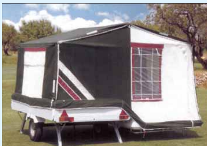
Tjaldvagn af því tagi sem sjúkraliðum býðst til leigu í sumar.

Leigugjald er 10.500 krónur fyrir sex daga leigu.