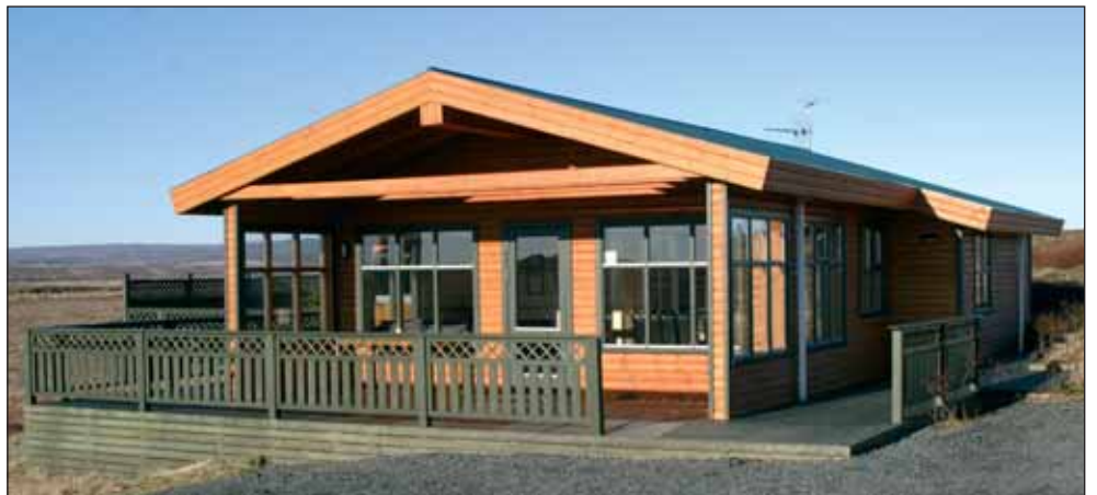
Fyrsta sumarhús Sjúkraliðafélags Íslands á Kiðjabergi í Grímsnesi.

Eins og flestum er kunnugt er fjölmargt að skoða á Suðurland, og má þar nefna Keríð í Grímsnesi, Gullfoss og Geysi, virkjanirnar í Soginu, Þjórsá, Þingvelli, Laugavatn og Skálholt svo fátt eitt sé talið.