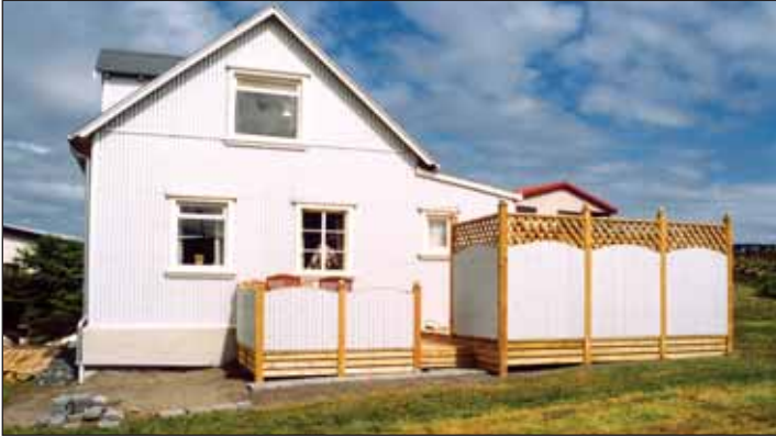
Íbúðarhúsið Fagrahlíð í Stykkishólmi. Á veröndinni er heitur pottur.