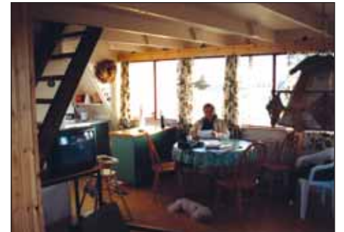
Séð inn í borðstofuna.

Fjölmargt annað er hægt að finna sér til afþreyingar á Snæfellsnesi, til dæmis hvalaskoðun, sleðaferð upp á Snæfellsjökul og útreiðar á Löngufjöru í Miklaholtshreppi og Kolbeinsstaðahreppi.