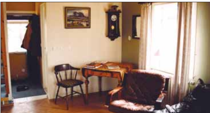
Í þessu gamla uppgerða húsi er fallett innan dyra.

Frá Arnarstapa er boðið upp á snjósleðaferðir á Snæfellsjökul, en í Ólafsvík er fiskasafn og hvalaskoðun.