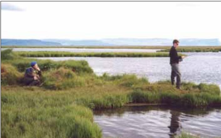
Sumarið býður upp á skemmtilega dvöl í íslenskrí náttúru.

Víð Hvitá er boðið upp á ofurhugasiglingu um strengi og flúðir árinna, svokallað „rafting“ sem mörgum þykir áhugavert ævintýri.