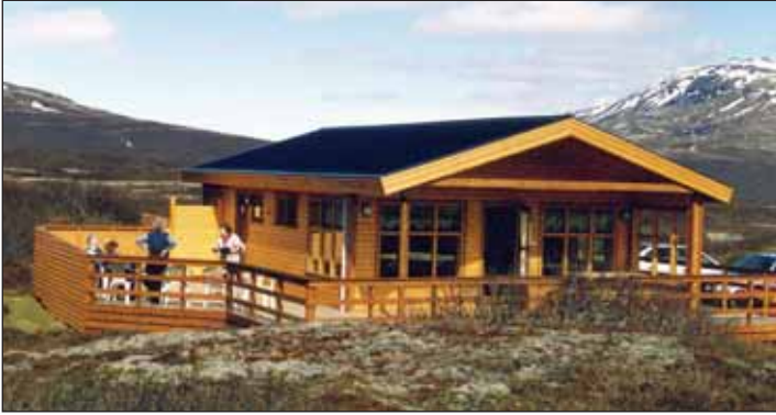
Sigurhæð, sumarhús félagsins í landi Úthlíðar í Biskupstungum.