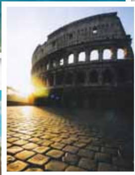
Róm borgin eilífa.