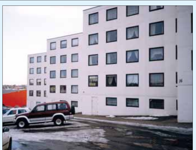
Sjúkraliðar eiga þriggja herbergja íbúð í þessu húsi við Fellsmúla 16 í Reykjavík.