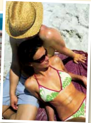
Algarve – sumar í Portugal.