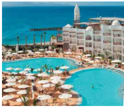
Lanzarote – ævintýraeyja.