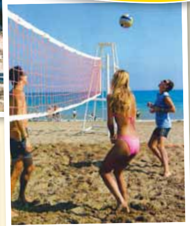
Alicante – borgin á Costa Blanca.