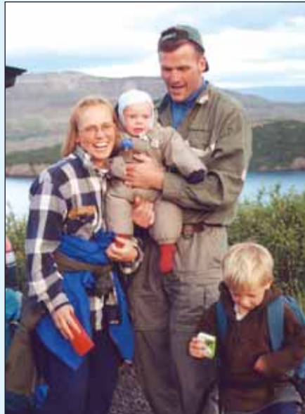
Sumarferð í íslenski náttúru.

Við úthlutun fækkar áunnum punktum eftir því á hvaða tíma sumars félagsmaðurinn leigir hús eða íbúð. Fyrstu tvær vikur sumarsins kosta aðeins einn punkt, næstu fjórar vikurnar kosta fimm punkta, sex vikur yfir hásumarið kosta tíu punkta, næstu tvær þar á eftir fimm