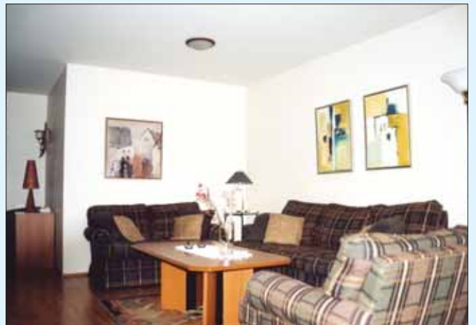
Íbúð félagsins við Fellsmúla er vel búin húsgögnum.

Einnig er stutt að fara í verslanir. Skeifan og Kringlan með öllum sínum verslunar- og þjónustumiðstöðvum og veitingastöðum eru í göngufæri frá íbúðinni.