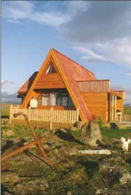
Sumarhúsið Hruni við Hellissand á Snæfellsnesi.

Hruni er sumarhús skammt austan og ofan við Hellissand á Snæfellsnesi. Bústaðurinn er í göngufæri við þorpið sem er norðan við hinn sögufræga Snæfellsjökul.