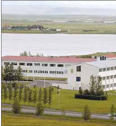
Edduhótelin eru 13 talsins um allt land.

Ef gestir vilja gista í betur útbúnu herbergi en að framan greinir þarf að greiða aukagjald sem hér segir: