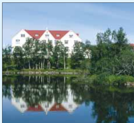
Fosshótelin eru víðsvegar um landið. Myndin er frá Fosshótelinu að Laugum í Þingeyjasýslu.