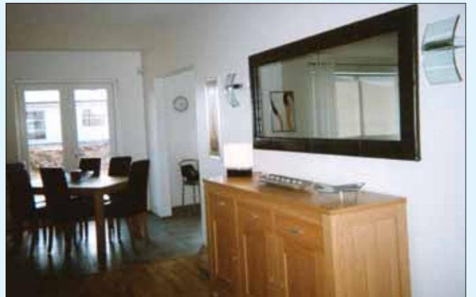
Íbúðin á Akureyri er tæplega eitt hundrað fermetrar að stærð og vel búin húsgögnum, heimilistækjum og með sólverönd.

Frá Akureyri er tilvalið að fara í dagsferðir ekki aðeins um blómlegt Eyjafjarðarsvæðið heldur einnig inn í Svarfadal að vestanverðu og austur að Mývatni. Eins er hægt að sigla til nærliggjandi eyja. Ferjan til Hríseyjar leggur upp frá Árskógströnd, en fara þarf til Dalvíkur til að ná ferjunni til Grimseyjar.