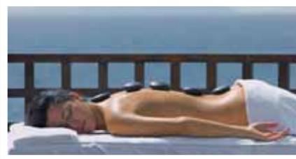
Benidorm – Miðjarðarhafsströnd.