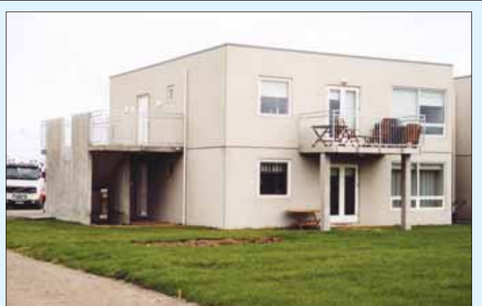
Sjúkraliðafélag Íslands á íbúð á jarðhæð í þessu nýja raðhúsi að Hamratúni 26 á Akureyri.