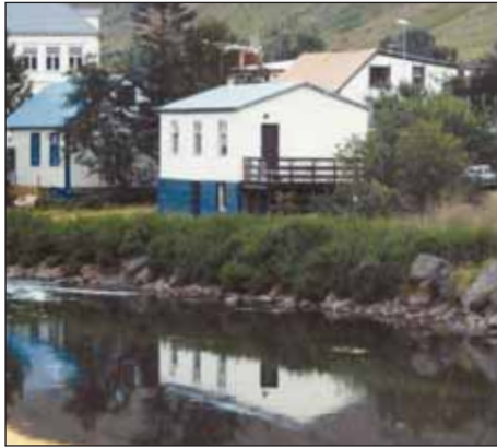
Þetta gamla og skemmtilega hús er við bakka Fjarðarár þar sem hún rennur í gegnum Seyðisfjörðarkaupstað.

Hægt er að gera sér marga til skemmtunar og afþreyingar á Seyðisfirði. Þar er sundlaug og níu holu golfvöllur. Einnig er