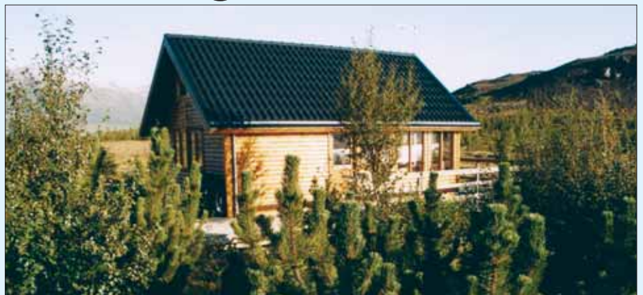
Ásholt er í landi Strandar á Héraði. Þaðan er einungis um 11 kílómetra leið til Egilsstaða.

Aðeins er um tíu mínútna akstur til Egilsstaða (11 kílómetrar). Þaðan er stutt til allra átta á Austurlandi, til dæmis um Njarðvíkurskriður til Borgarfjarðar eystri, eða yfir Fjarðarheiði til Seyðisfjarðar sem lumar í skjóli hárra fjalla á fögrum og sérstæðum byggingum frá sildarárum Nordmanna á Íslandi og Wathnefjölskyldunnar er setti svip sinn á bæjarlífið á fyrri tíð.