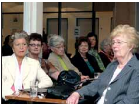
Félagar í Eftirlaunadeild Sjúkraliðafélagsins fylgjast með á ráðstefnunni.

Það er deildarlæknir og tvær konur. Það er sterk reyklarlykt í herberginu því læknirinn er að reykja pípu.