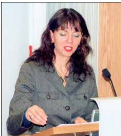
Siv Friðleifsdóttir, heilbrigðisráðherra, í ræðustól á ráðstefnunni.

„Mér er kunnugt um að einhverjir sjúkraliðar hafa lýst yfir óánægju með sjúkraliðabréuna. Ég vona þó að umræða um námið leiði til meiri sáttar um þá námsleið og að jafnframt verði tekið vel á