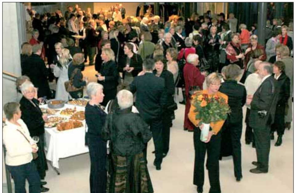
Sjúkraliðar og velunnar stéttarinnar fjölmenntu í afmælishófið sem haldið var í anddyri Laugardalshallar.

Við stofnun Sjúkraliðaskóla Íslands í október 1975 voru að hálfu stjórnenda skólans gerðar meiri kröfur um menntun nemenda sem óskuðu eftir inngöngu í skólann. Með því voru margir áhugasamir einstaklingar útilokaðir frá námi. Í mörgum tilfellum var um að ræða konur sem horfið höfðu frá námi til að sinna heimilistörfum og barnauppleidi. Að