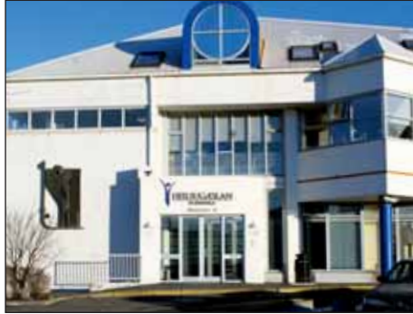
Miðstöð heimahjúkrunar höfuðborgarsvæðisins hefur aðsetur á þriðju hæð í þessu húsi við Álfabakka í Mjóddinni.

„Sjúkraliðar og hjúkrunarfræðingar hjá heimahjúkrun gæta vel að sér á nóttunni og eru mjög varkárar,“ segja sjúkraliðarnir. „Það fara alltaf hjúkrunarfræðingur og sjúkraliði saman í vitjanir á nóttunni. Sumar fara alls ekki í hjúkrunargalla í vitjanir í miðbænum á kvöldin og nóttunni til þess að forðast að draga að sér athygli, og bílarnir