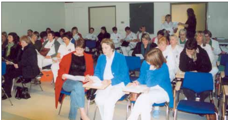
Stofnanasamningurinn kynntur á fundi sjúkraliða á Landspítala Fossvogi.

„Í þessum viðræðum höfum við líka verið að leiðrétta framgang sjúkraliða á nokkrum ríkisstofnunum,“ segir formaður Sjúkraliðafélagsins. „Á sumum stofnunum hefur framgangur verið lítill. Margar stofnanir voru komnar út fyrir stofnanasamningana sem þær áttu að vinna eftir.