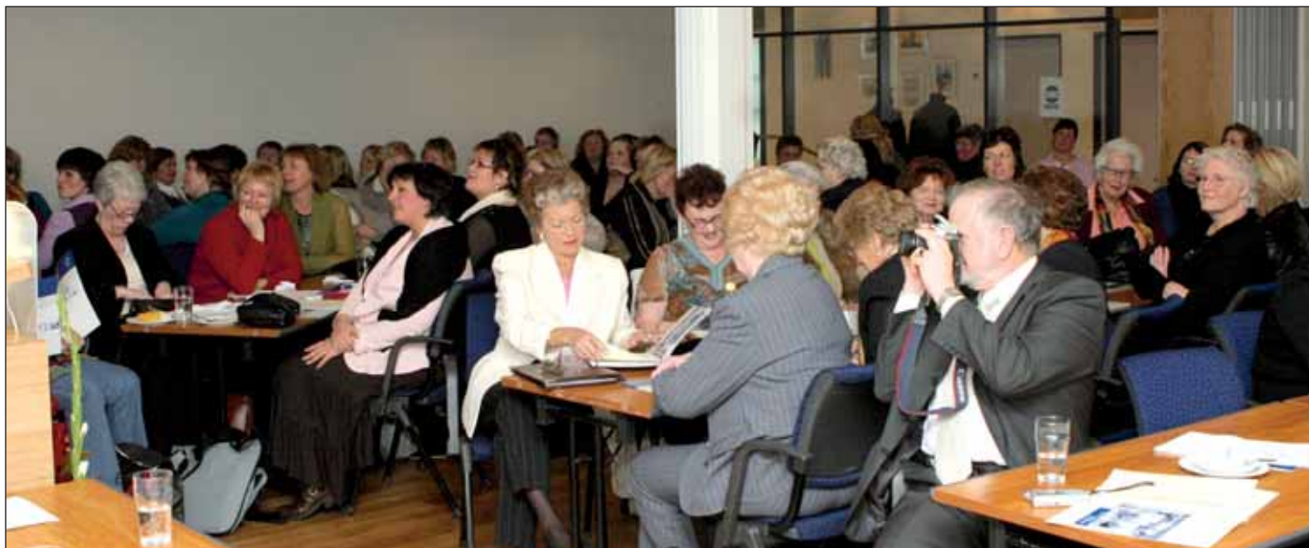
Sjúkraliðar hlýða á framsöguerindi á afmælisráðstefnunni um hlutverk og hlutskipti sjúkraliða.

Siv Friðleifsdóttir, heilbrigðisráðherra, á afmælisráðstefnunni: