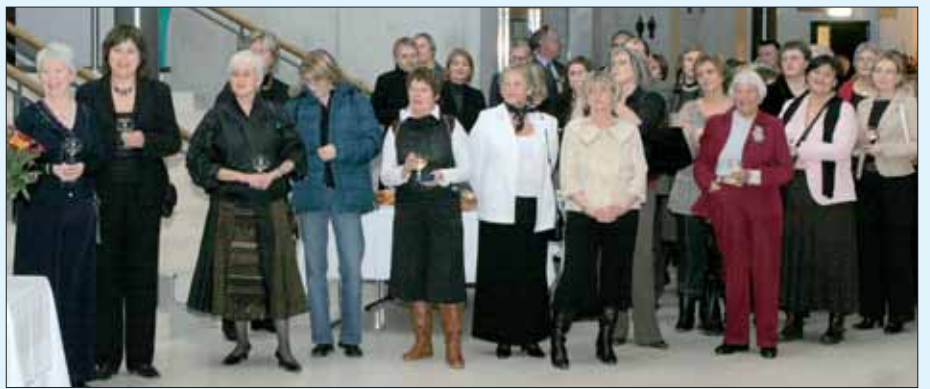
Gestir í afmælishófi Sjúkraliðafélags Íslands hlýða á formann félagsins flytja ávarp og afhenda viðurkenningar félagsins í tilefni fjörutíu ára afmælisins.

Ég vil fyrir hönd forystu Sjúkraliðafélags Íslands biðja þessar heiðurskonur að taka við viðurkenningu félagsins og sjúkraliða sem eiga þeim svo miklar þakkir að gjalda fyrir óeigingjörn störf í þeirra þágu og samfélagsins í heild. Þær hafa frá upphafi orðið til að efla félagsvitund sjúkraliða og staðið vörð um hagnunni heildarinnar í blíðu og stríðu. Fyrir forgöngu þeirra og breytni hafa einkunnarorð Sjúkraliðafélags Íslands fengið raunverulega merkingu: Samstaða er afl sem ekkert fær staðist.”