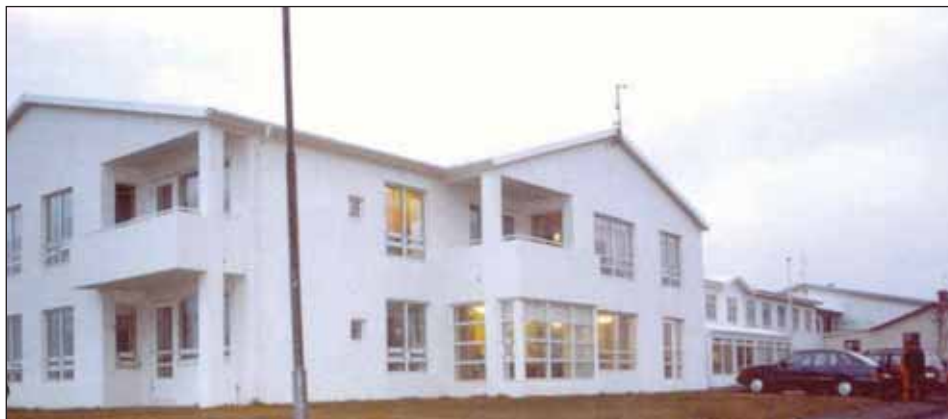
Dvalarheimili aldraðra í Stykkishólmi, einn vinnustaða sjúkraliða á Vesturlandi.

Formenn deildanna samþykktu á þessum tíma að þeir skyldu hittast einu sinni á ári í tengslum við félagsstjórnarfund og bera saman bækur sínar. Þeir hittust svo í fyrsta skipti í tengslum við afmæli SLFÍ sem varð 40 ára 21. nóvember. Á afmælinu var formanni Sjúkraliðafélagsins fært hálsmen að gjöf frá landshlutadeildunum fyrir vel unnin störf í þágu sjúkraliða.