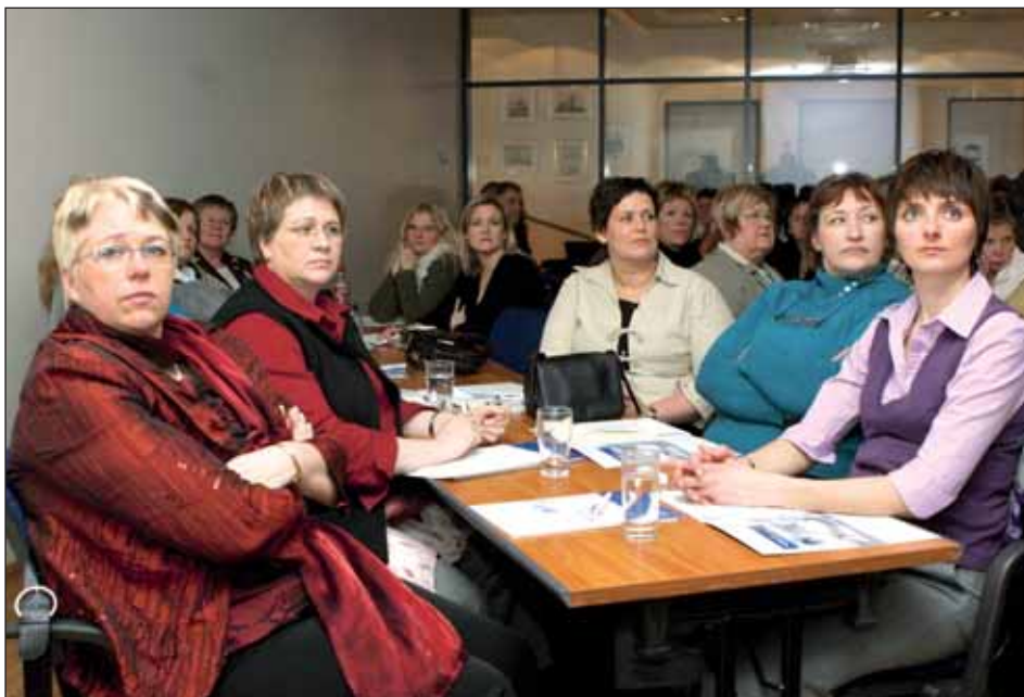
Fylgst af athygli með fyrirlestri á ráðstefnunni um hlutverk og hlutskipti sjúkraliða.

Eftir því sem leið á námið sá ég að ég hafði valið alveg rétt, skilningur minn á starfi mínu jókst og ég fór að vinna á faglegan hátt. Heildarmyndin stækkaði og sjóndeildarhringurinn vikkaði. Ég fór að hugsa öðruvísi, hugsaði um manneskjuna í heild sinni, orsök og afleiðingu þeirra hluta sem ég gerði, og ekki síst: „Aðgát skal höfð í nærveru sálar“ sem er eitt af mínum uppáhalds máltækjum og