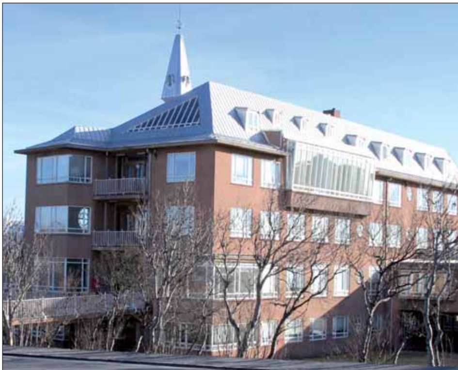
Heimahjúkrunin var lengi til húsa í Heilsuverndarstöðinni við Barónsstíg.

Fram undir miðja 20. öld var ástandið slæmt á mörgum heimilum í bænum enda var kvennadaudi á aldrinum 10-40 ára mjög hár eða hærri en víðast hvar á Norðurlöndum og jafnvel þótt víðar væri leitað. Álagið var griðarlegt við hjúkrun berklasjúklinga í heimahúsum. Mjög mikil hætta var á smiti frá öndunarvegi og öllum áhöldum, fatnaði og rúmfötum.