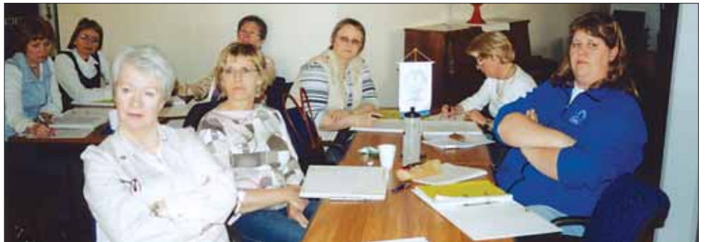
Fulltrúaþing Sjúkraliðafélags Íslands að störfum.

Munum að samstaða er afl sem ekkert fær staðist.