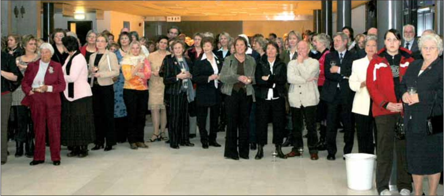
Gestir í afmælishófinu hlýða á formann félagsins flytja ávarp og afhenda viðurkenningar félagsins í tilefni af fjörutíu ára afmælinu.

annað tveggja –tækni eða –fræðingur svo við séum í takt við tímann. Við yrðum þá annað tveggja „Sjúkratæknar“ eða „Sjúkrafræðingar“. Hvernig litist ykkur á?