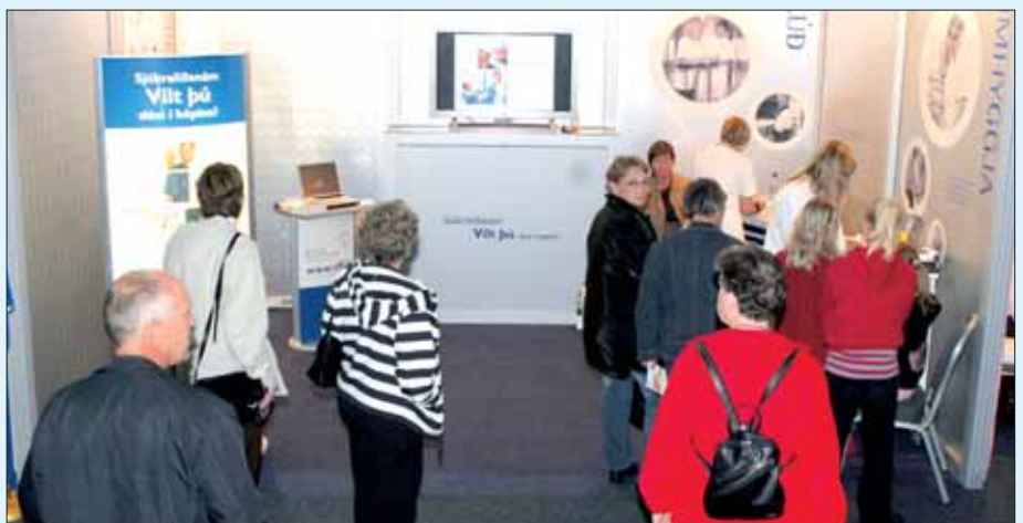
Hér sést yfir sýningarbás sjúkraliða í Egilshöll. Þar var fjölmennt alla sýningardagana.