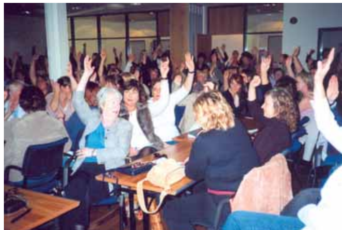
Margar hendur á lofti á almennum félagsfundi sjúkraliða í Reykjavík og nágrenni 27. september 2006, en þar var samþykkt ályktun þar sem þess var krafist af viðsejendum Sjúkraliðafélags Íslands að gengið yrði án frekari tafa frá stofnanasamningum við sjúkraliða.

Framgangurinn var stundum í formi einhverra launaflokka sem ekki voru skilgreindir inn í stofnanasamning. Við höfum verið að leiðrétta þetta og færa allar hækkanir inn í samningana.