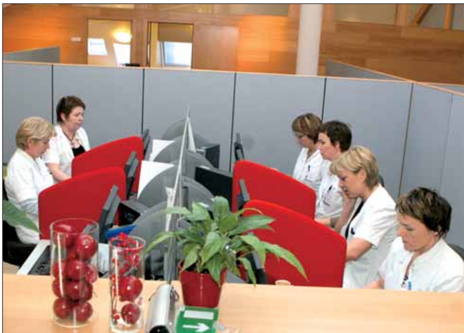
Sjúkraliðar í heimahjúkrun að störfum við tölvurnar í Miðstöð heimahjúkrunar við Álfabakka.

sjúkraliða. Tiltölulega lítil breyting varð næstu ár á eftir, eins og ráða má af því að á árinu 1998 voru starfandi 24 starfsmenn í 19,4 stöðugildum, sem skiptust nokkurn vegin jafnt milli hjúkrunarfræðinga og sjúkraliða. Mikil fjölgun hefur síðan orðið síðustu árin, sem sést af því að á árinu 2003 voru ársverk við heimahjúkrun alls 69,83 talsins, þar af hjúkrunarfræðinga 23,91 og sjúkraliða 43,57. Er því ljóst að auk þess sem starfsfólki við heimahjúkrun hefur fjölgað verulega síðustu árin, hafa sjúkraliðar þar tekið að sér vaxandi hlutverk og eru þar í miklum meirihluta.