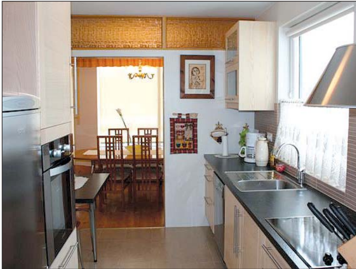
Eldhúsið í íbúð sjúkraliða við Fellsmúla 16 í Reykjavík hefur verið endurnýjað rækilega.