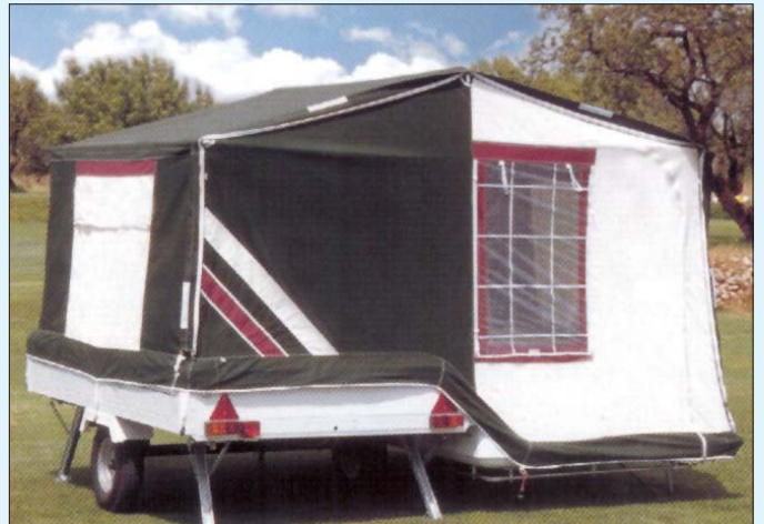
Tjaldvagn af því tagi sem sjúkraliðum býðst til leigu í sumar.

Leigugjald er 11.500 krónur fyrir sex daga leigu.