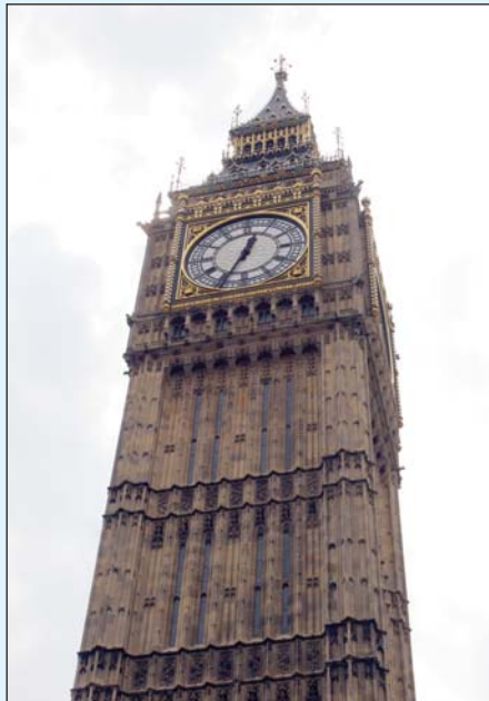
Big Ben í London.