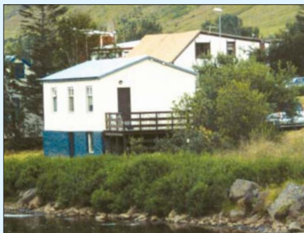
Þetta skemmtilega gamla hús er við bakka Fjarðarár sem rennur í gegnum kaupstaðinn til sjávar.

Byggðir hafa verið miklir snjóvarnagarðar í hlífum Bjólfs, fjallsins sem gnæfir yfir bæinn. Á sumrin er auðvelt að aka eftir merktum vegi sem lagður er frá þjóðveginum skammt fyrir neðan skíðaskála Seyðfirðinga í Stafdal, en þegar út í Bjólf er