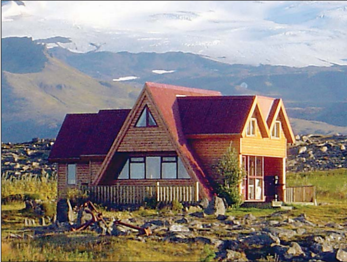
Sumarhúsið Hrúni við Hellissand á Snæfellsnesi er á afar fallegum stað þar sem útsýnið er glæsilegt.