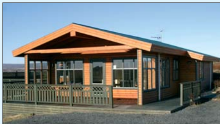
Bæði sumarhús félagsins á Kiðjabergi eru heilsárs hús og búnaður þeirra er sá sami.

Hægt er að fá veiðileyfi í Hvítá fyrir landi Kiðjabergs gegn vægu gjaldi og fría silungsveiði í Hestvatni sem er skammt frá bústöðunum. Stutt er í sundlaug með heitum pottum og vatnsgufubaði, hestaleigu,