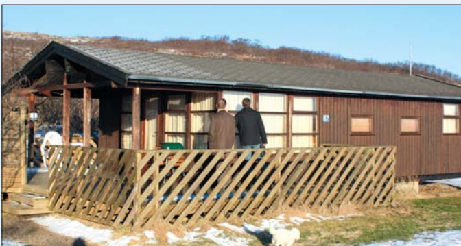
Sumarhúsið sem Sjúkraliðafélag Íslands leigir út í Munaðarnesi er númer 67.

Sundlaugar, hestaleigur og golfvelli er víða að finna í héraðinu.