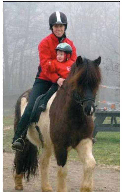
Sjúkraliðar geta notið sumardvalar með fjölskyldum sínum víðs vegar um landið í sumar.

11.500 krónur fyrir 6 daga, frá 19. júní til 28. ágúst.