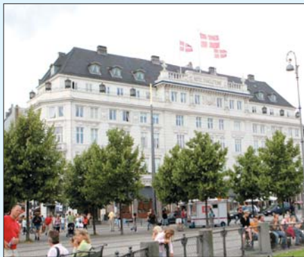
Iceland Express flýgur til 18 evrópskra borga á sumrin, þar á meðal til Kaupmannahafnar þar sem hægt er að njóta lífsins við Kóngsins Nýjatorg.