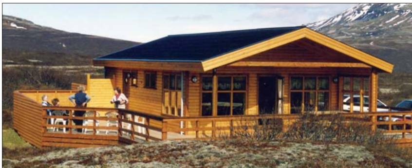
Sigurhæð, sumarhús félagsins í landi Úthlíðar í Biskupstungum.

Sængur og koddar eru fyrir sjö manns, en auk þessa fylgir barnarúm, barnastóll og tvær dýnur, en engin sængurver. Umhverfis húsið er 70 fermetra verönd með heitum potti og gufubaði.