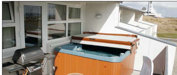
Á svölum raðhússins í Stykkishólmi er heitur pottur og gasgrill.