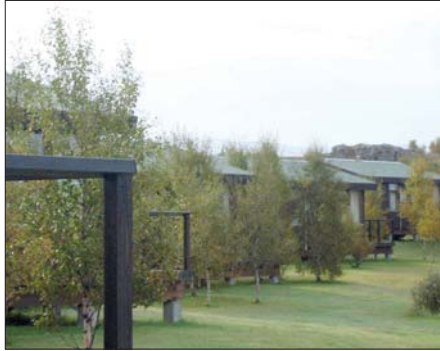
Eiðar - nýr dvalarstaður sjúkraliða í sumar.

Héraðið er einn veðursælasti ferðamanna- staður á landinu, enda býr svæðið yfir mörgum náttúruperlum sem eru þess virði að heimsækja. Nægir þar að nefna Atlavík, Hallormstaðaskóg, Skriðuklaustur og Lagarfljótið sem liðast eftir miðju Héraðinu.