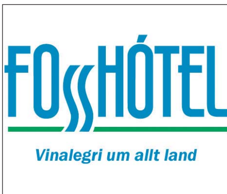
Fosshótelin eru víðs vegar um landið.

Greiða skal í gestamóttöku aukagjald í júní á Fosshótel Baron, Fosshótel Lind og