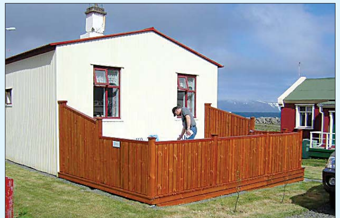
Parhúsið við Hafnargötu 101 í Bolungarvík.

Ýmislegt er hægt að gera til afþreyingar á staðnum. Mörgum finnst gaman að dorga á bryggjunni. Hægt er að taka hressandi sundsprett og slappa af í heitum potti í íþróttamiðstöðinni, en þar er gufubað, líkamsrækt, frábær sólbaðsaðstaða á útsvæði og sundlaugargarður með rennibraut. Á flötinni við tónlistarskólann eru minigolf-brautir þar sem hægt er að æfa þúttið. Þar er einnig leikvöllur fyrir yngstu börnin. Við grunnskólann er gervigrasvöllur og körfuboltavöllur. Í Syðridal er frábær 9 holu golfvöllur með tvöföldu teigasetti og hann því viðurkenndur sem 18 holu golfvöllur. Völlurinn er einn fárra sandvalla á landinu og þykir umgjörð hans og vallarstæði einkar heillandi.