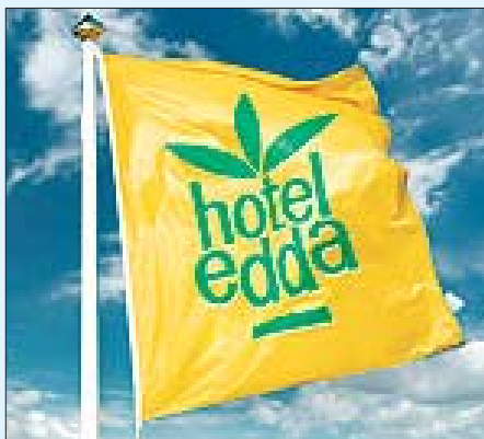
Edduhótelin eru þrettán talsins um allt land.

Ef gestir vilja gista í betur útbúnu her-