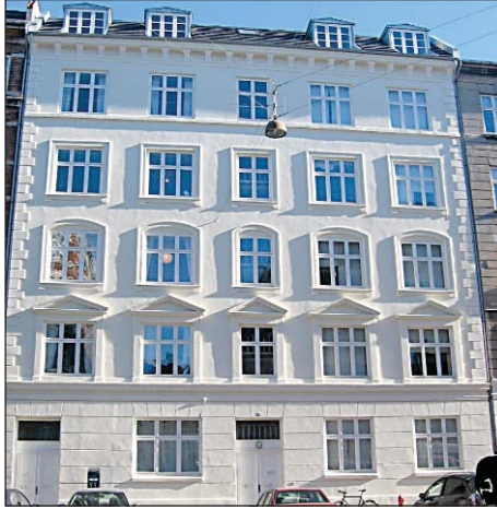
Húsið við Flensborggade 39.

Íbúarnir hafa aðgang að lokuðum bakgarði sem hefur upp á að bjóða fína aðstöðu til leiks, afslöppunar og afþreyingar auk þess sem umhverfið er öruggt fyrir börn.