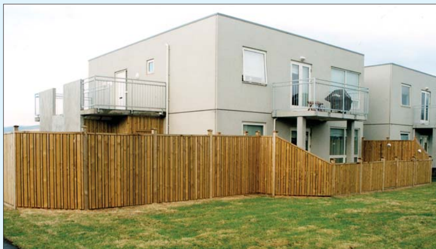
Sjúkraliðafélag Íslands á íbúð á jarðhæð í þessu nýja raðhúsi að Hamratúni 26 á Akureyri.

einstaka veðurblíðu. Allt svæðið beggia vegna fjarðarins er gróðursælt og heillandi. Þar er hægt að fara í sund eða siglingar og spila golf. Gönguferðir um