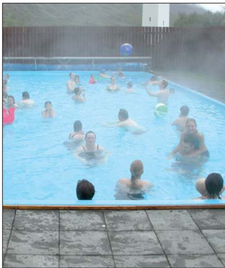
Í sundi á Hólum.

Á Hólum eru góðir möguleikar til lengri og styttri gönguferða, og eins skoðunar- ferða um nágrennið. Í Skagafirði eru söfn, hestaleigur, veiðivötn, golfvöllir og sund- laugar. Nánari upplýsingar um staðset- ingu og atburði má finna á vefslóðinni: www.skagafjordur.is