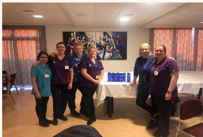
Jólahitting sjúkraliða Borgarnesi/Borgarfirði