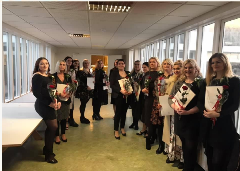
jólahitting sjúkraliða í Borgarnesi/Borgarfirði