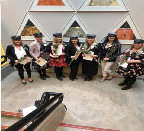
Útskriftarnemar í maí 2020

Alls útskrifuðust 27 sjúkraliðanemar frá Fjölbrotaskóla Vesturlands á Akranesi á þessu starfsári, 19 sjúkraliðanemar í desember og 8 sjúkraliðanemar í maí. Fóru tveir fulltrúar deildarinnar upp í skóla og afhendu útskriftarnemum rós og skjal þar sem við óskum þeim til hamingju með árangurinn og bjóðum þá hjartanlega velkomna í félagið og óskum þeim velfarnaðar í starfi.