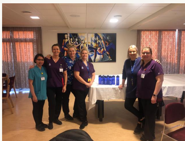
Sjúkraliðar frá Dvalarheimilinu Höfða á Akranesi