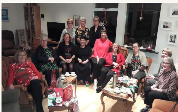
Sjúkraliðar frá Dvalarheimilinu Höfða á Akranesi