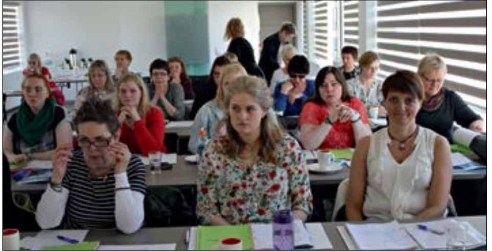
Hluti fundarmanna á þingi Sjúkraliðafélags Íslands.

Fundir í fræðslunefndinni voru 5 formligir,