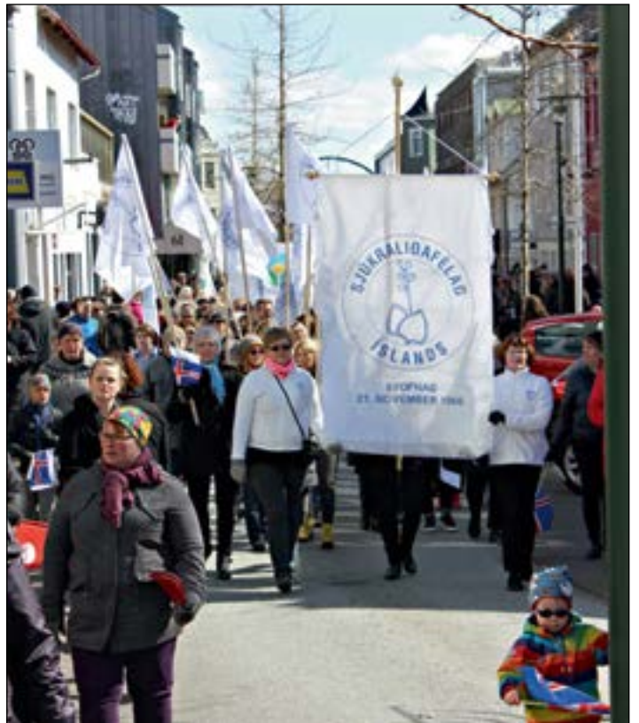
Fáni Sjúkraliðafélagsins í fararbroddi.