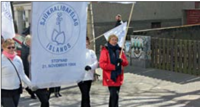
Sjúkraliðar gengu niður Laugaveginn undir fánum Sjúkraliðafélagsins

Maistjarnan og „Internationallinn“ voru flutt undir lok úti-fundarins.