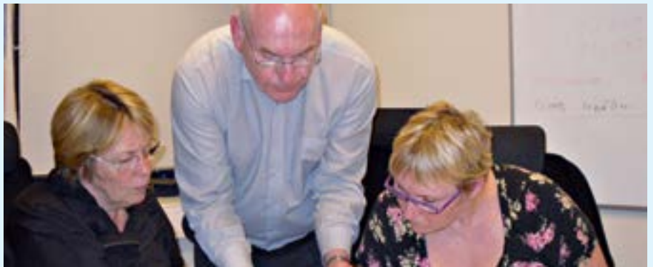
Sjúkraliðar á kafi í samningaviðræðum við ríkisvaldið.

4) Á óvart kemur hversu hátt hlutfall fólks nær ekki markmiði samtryggingarsjóðanna um 56% lífeyrishlutfall af meðalævitekjum, sérstaklega úr lífeyrissjóðunum á almennum vinnumarkaði.