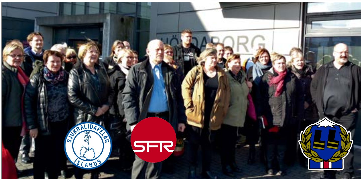
Samninganefndir Þríeykisins fagna undirritun samkomulags um samstarf stéttarfélaganna þriggja í kjarasamningaviðræðunum.