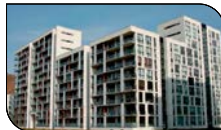
Hægt er að bóka á orlofsvef SLFÍ gistingu í Kaupmannahöfn út árið. Frá 17. september verður hægt að bóka fyrir allt árið 2016.

Leigutökum íbúðanna í Reykjavík og á Akureyri býðst að leigja sængurfatnað og handklæði.