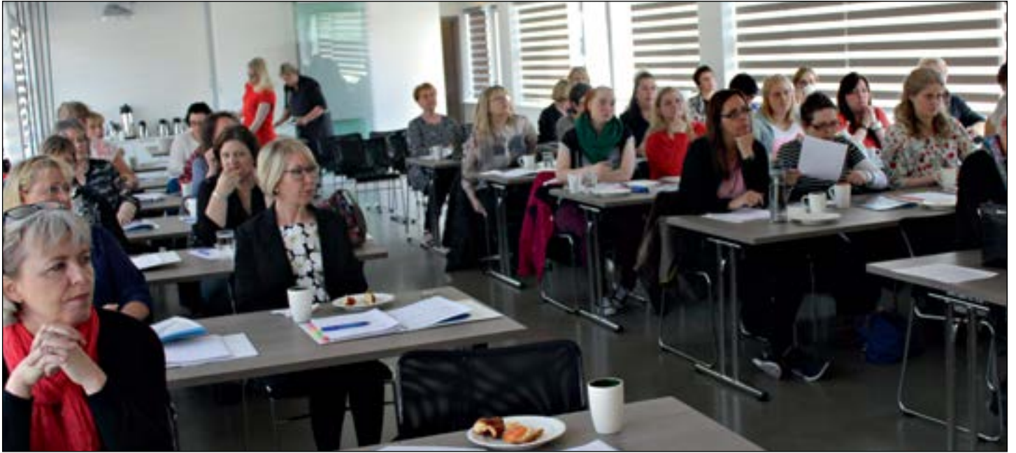
Séð yfir fundarsalinn á Fulltrúaþingi Sjúkraliðafélags Íslands sem var haldið í nýrri félagsaðstöðu Sjúkraliðafélagsins.

tvær gönguferðir um hálendi Íslands með farastjóra.