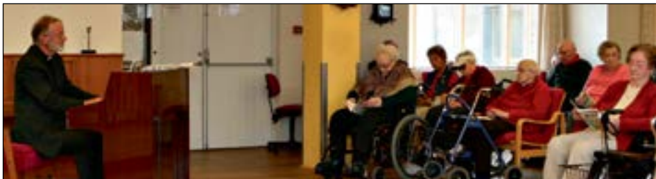
Tónleikar á Hlíð. Myndin var tekin þegar Sjúkraliðinn heimsótti heimilið.

Stefndi byggir á því að þrátt fyrir þetta beri ekki að fella umrædda sjúkraliða í B flokk, enda hafi aðeins verið um að ræða orðalagsbreytingu sem ekki hafi verið ætlað að hafa önnur áhrif en þau að sjúkraliðar sem sinna fólki sem er ósjálfbjarga vegna líkamlegrar vanheilsu njóti ekki lakari kjara