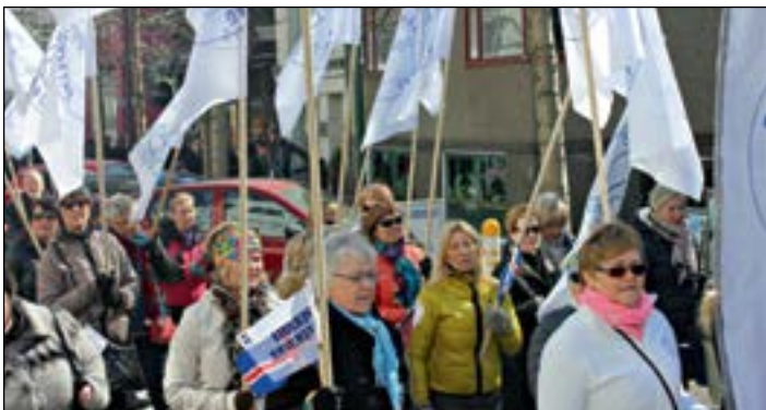
Sjúkraliðar í kröfugöngunni fyrsta maí 2015.