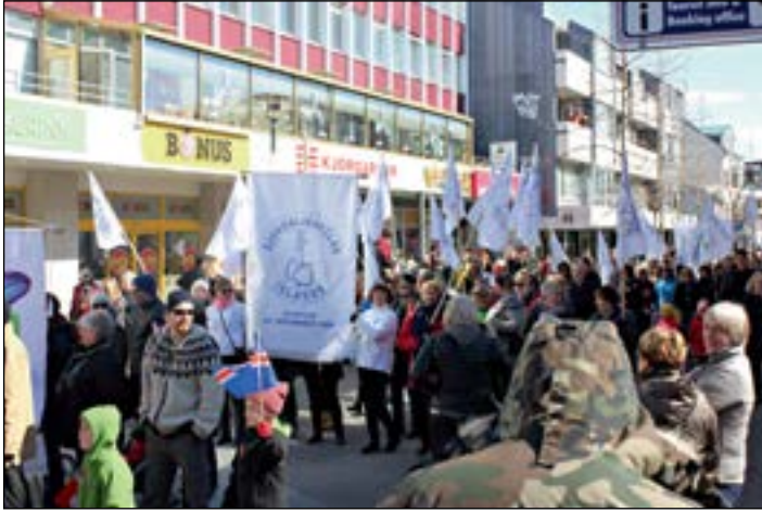
Fjöldi sjúkraliða safnaðist saman á Hlemmi þar sem gangan niður á Ingólfstorg hófst, en hún tók um eina klukkustund.