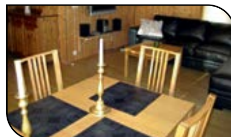
Frá og með 20. ágúst verður hægt að bóka haustleigu í bústöðum og íbúðum félagsins.