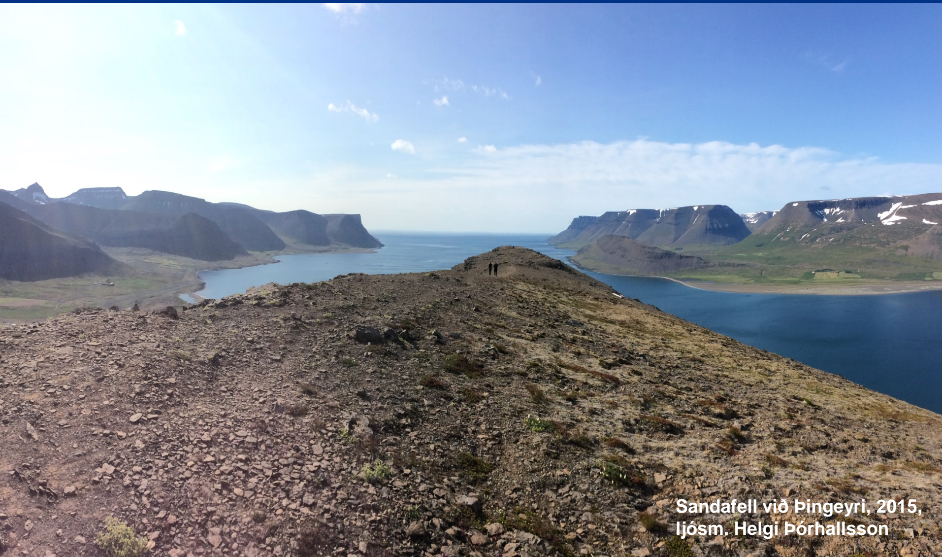
Sandafell við Þingeyri, 2015, ljósm. Helgi Þórhallsson